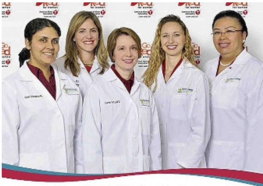
Midwest Heart Care Team van vrouwelijke cardiologen

Slechts 7% van de cardiologen in de wereld is vrouw. Een daarvan is Dr. Har-